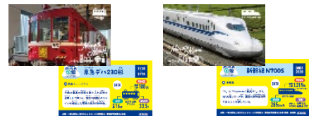
のりものカード <施設6種+新幹線4種>