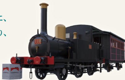
JR東日本商品化許諾済

さらに「鉄道開業150年 Twitter ハッシュタグキャンペーン第2弾」も開催!