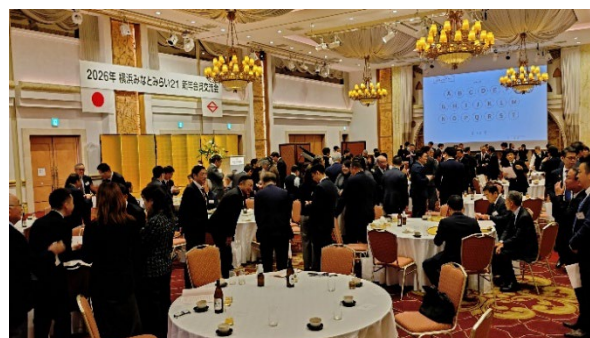
< 2026 年横浜みなとみらい21 新年会員交流会 >